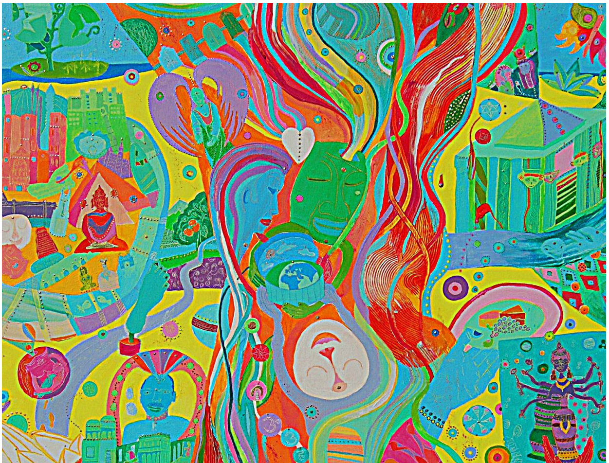
Gemälde Rosie Jackson: The World Vision C: World in a box