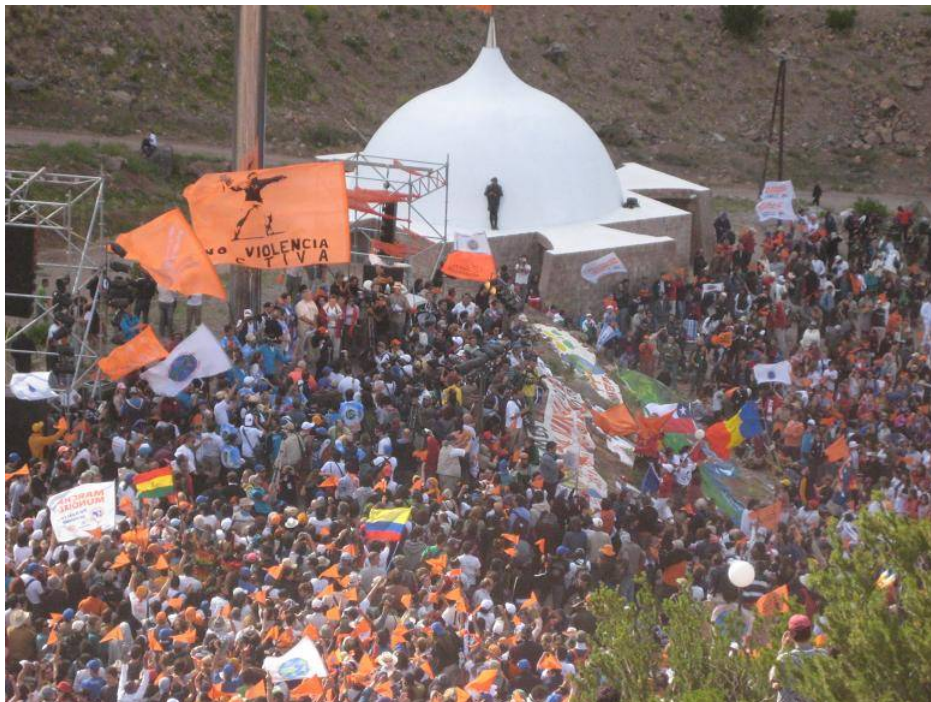
Hier ist der der weltweite Marsch angekommen