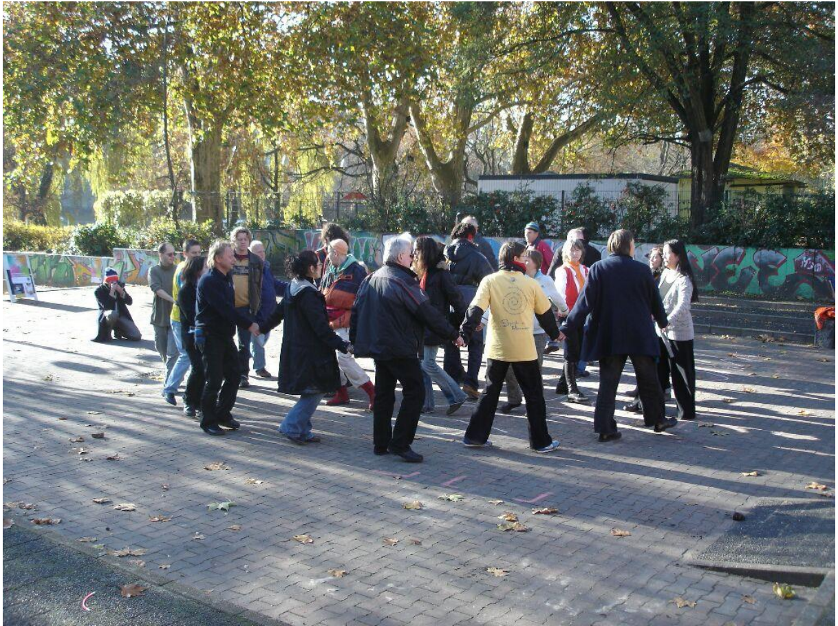
Spiraltanz bei Sonnenschein.