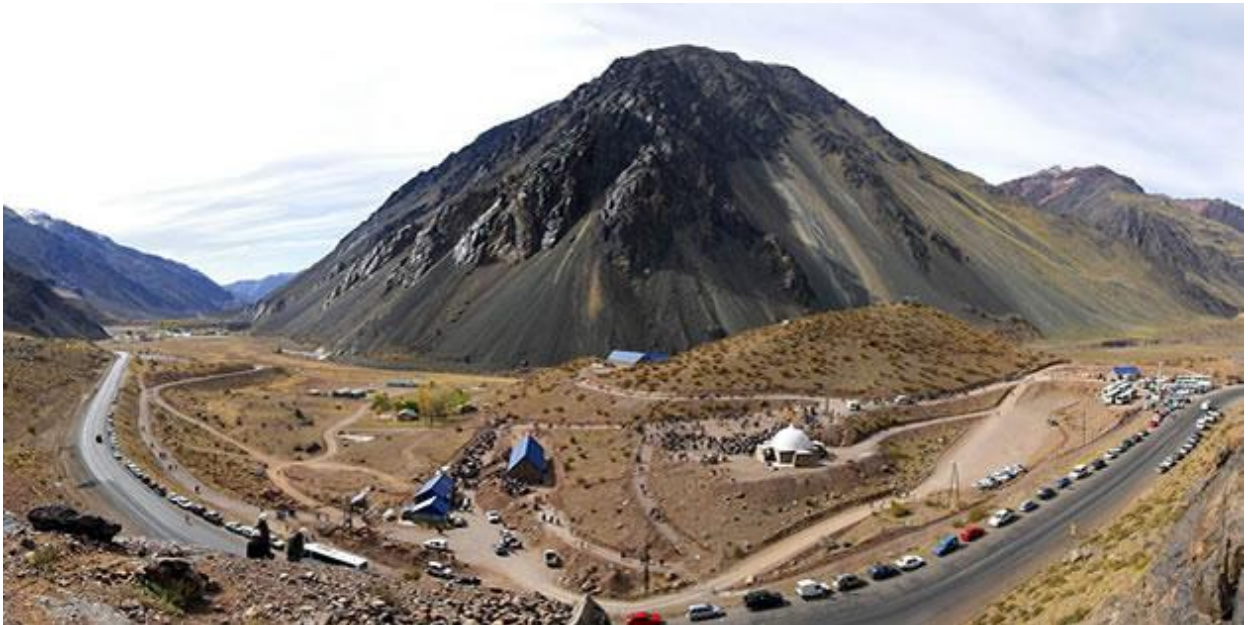
Das ist das Reiseziel des Weltweiten Marsches: Aconcagua, Punta de Vacas Park, Argentinien