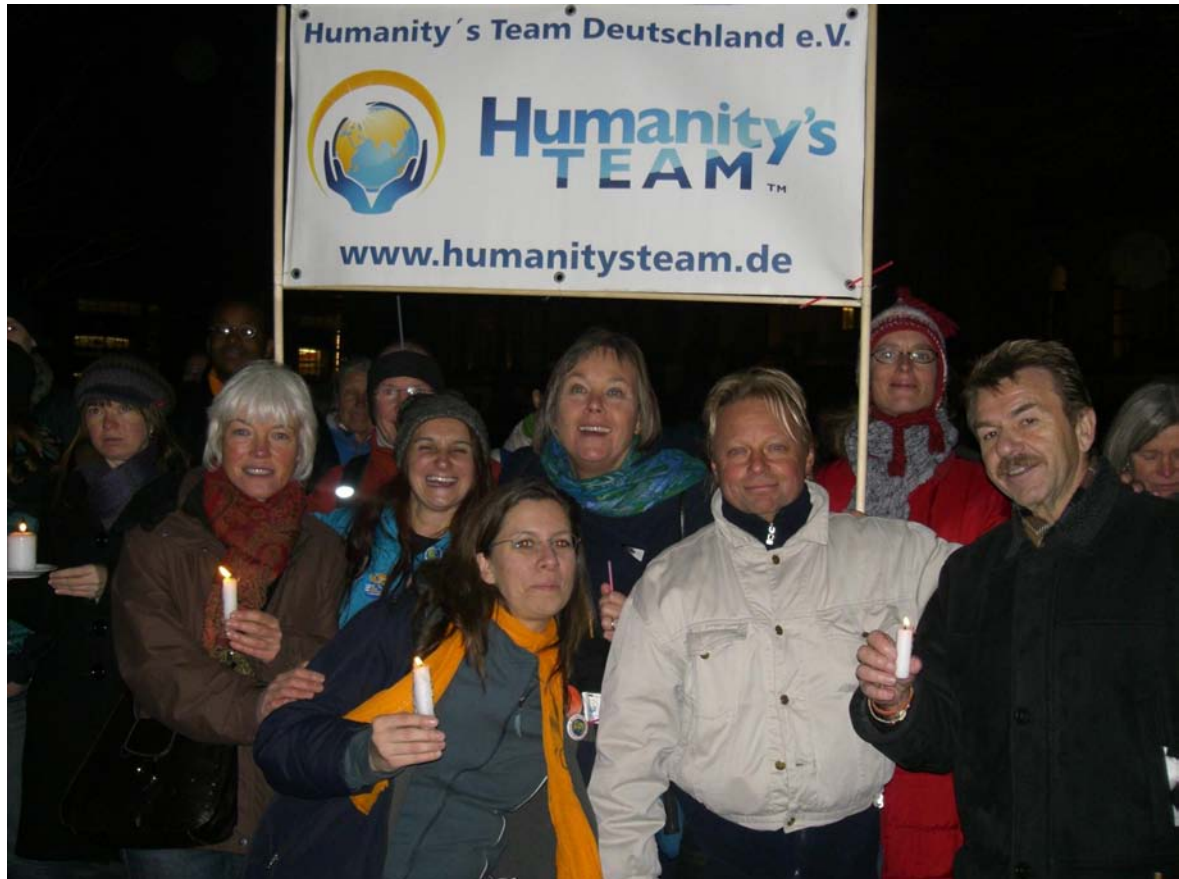
HT-Aktivisten bei der Kundgebung vor dem Berliner Reichstag

Für alle, die nach diesem relativ langen Marsch noch Lust auf Bewegung hatten, klang der Tag mit Tanz und Lifemusik am Veranstaltungsort im Böcklerpark aus.