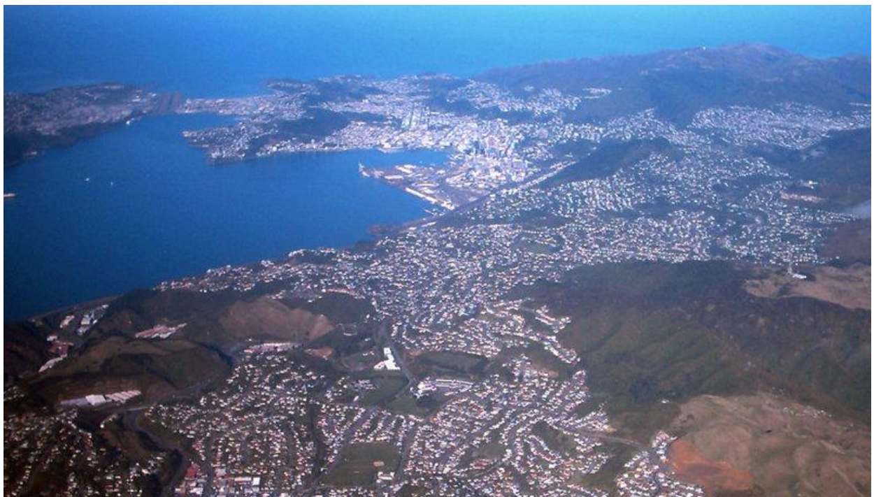
Wellington, Neuseeland: Hier hat der Weltweite Marsch begonnen

Neale D. Walsch, Tägliche Botschaft vom 24.11.09