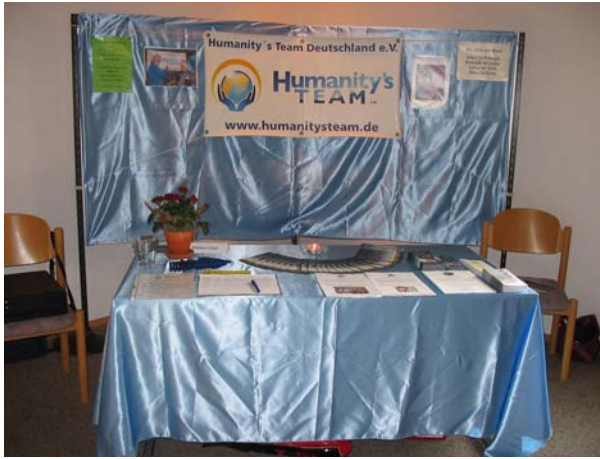
Unser Humanity's Team Stand